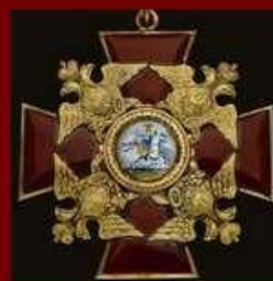
Орден Святого князя Александра Невского