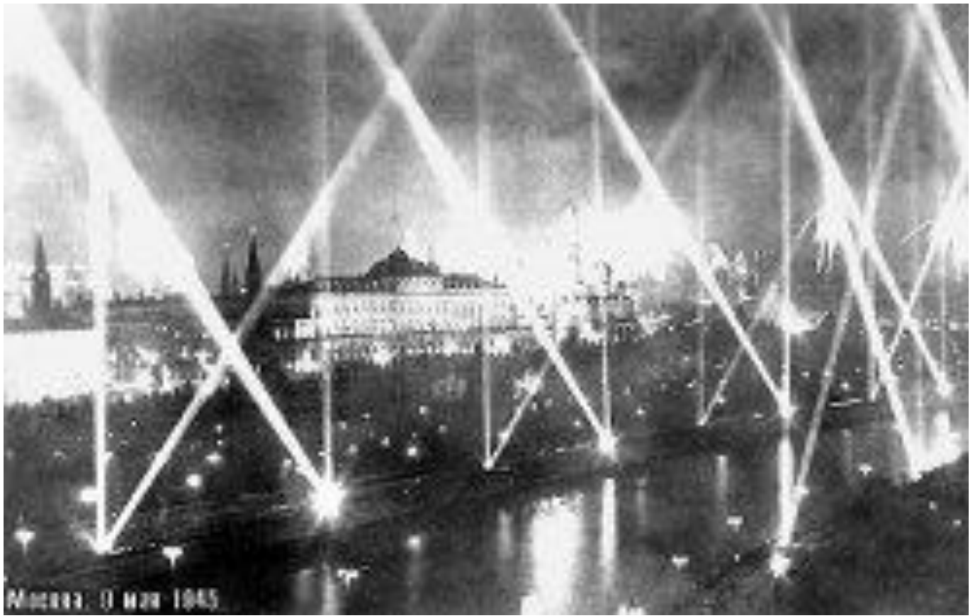
Москва. 3 мая 1945